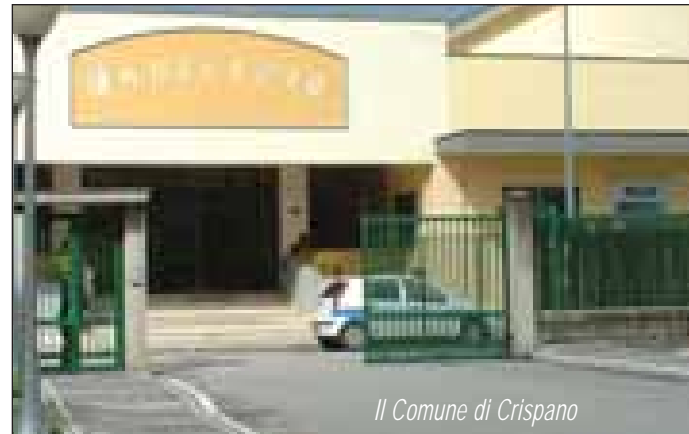
Il Comune di Crispano

sumando in questi giorni. Un gruppo di bambini della Scuola Elementare 'A.Moro' di Afragola si è ritrovato nella fase finale del prestigiosissimo 'Giffoni Film Festival', per un film che ha prodotto qualche mese fa. Film che è venuto fuori da una serie di lezioni sui 'valori' e sulle cose che nella vita veramente contano e che fanno dell'uomo un uomo. Un film che, ad onta della scadente qualità dell'audio e delle riprese, ha commosso chi l'ha visto perché metafora di quanto oggi sta accadendo e che ha segnato chi, come me, quell'esperienza con i bambini l'ha vissuta. Un film che consiglieri a tutti quelli che veramente credono che la politica sia