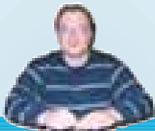
Direttore Responsabile: Tommaso Travaglino

Periodico di attualità, politica, informazione e cultura