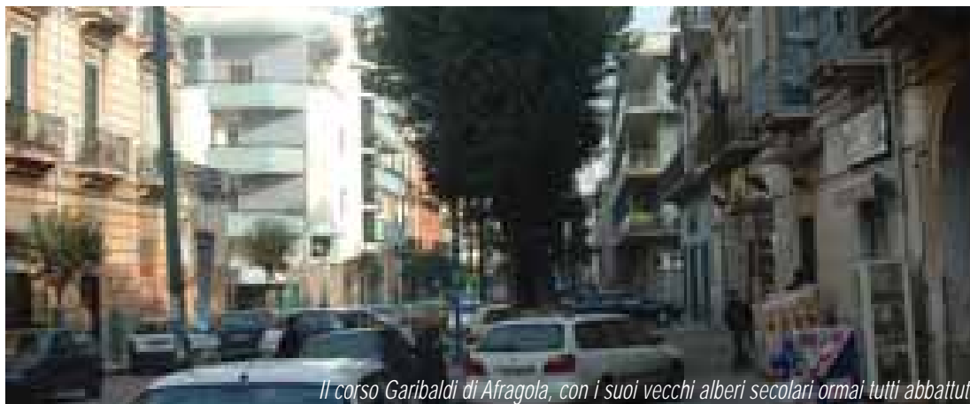
Il corso Garibaldi di Afragola, con i suoi vecchi alberi secolari ormai tutti abbattuti

Tagliati gli alberi centenari che verranno sostituiti con nuove piante. E gli ambientalisti gridano allo scempio e sollevano dubbi sulla legittimità dell'operazione di abbattimento degli alberi secolari.