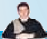
Impaginazione e grafica: Giovanni Liardi

Redazione, amministrazione e preparazione via M.R. Imbriani, 5 - Afragola - NA Tel. 0818516331 - 328.3773787 Email: assemediano@email.it