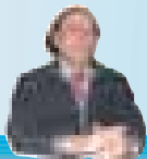
Caporedattore: Lino Sacchi