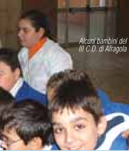
Alcuni bambini del III C.D. di Afragola