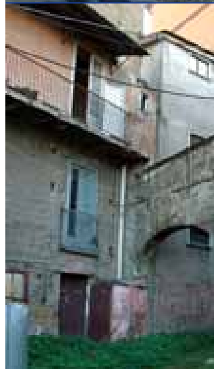
Nelle foto: Alcuni 'bassi' di Casalnuovo e palazzi rurali.