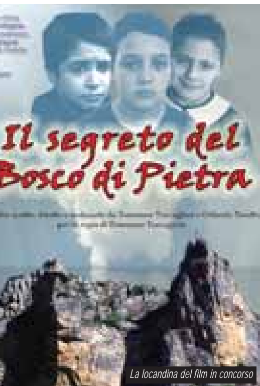
La locandina del film in concorso

'Il segreto del bosco di pietra', un film prodotto da un'associazione afragolese, in selezione al Giffoni Film Festival .